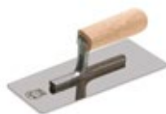
шпатель металлический (кельма)