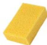
натуральная морская или синтетическая губка