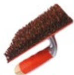
щетка для нанесения рисунка